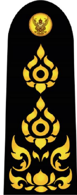
อินทรรูปเจ้าหน้าที่และลูกจ้าง ในตำแหน่งอื่น