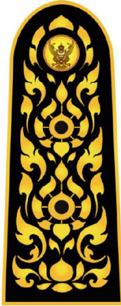
อินทรรูปเจ้าหน้าที่ ในตำแหน่งผู้บริหารระดับกลาง