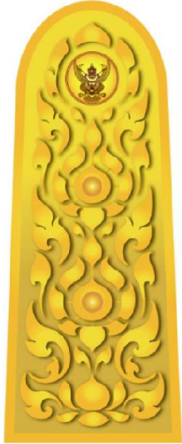
อินทรรูปผู้อำนวยการและ เจ้าหน้าที่ในตำแหน่งบริหารระดับสูง