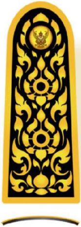
แสดงภาพตัดขวางอินทรรูปความโค้ง

รูปแบบ อินทรรูปมีลักษณะเป็นรูปสี่เหลี่ยมผืนผ้าแนวตั้งปลายด้านบนมนโค้งมีกระดุมครุฑ สีทองประดับอยู่ด้านบนมีรูปลายไทยประกอบเต็มพื้นที่